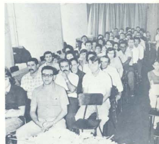
Aqui, todos reunidos antes de serem chamados para