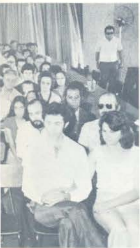
Receber as homenagens.