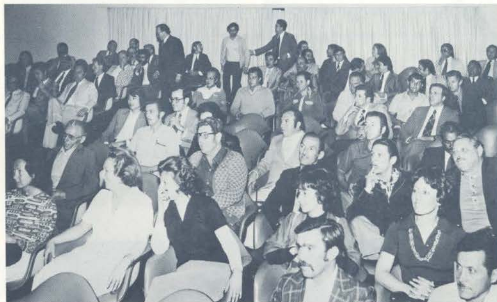
Os homenageados da área da Diretoria Administrativa ocuparam quase que todas as instalações do auditório.

COMPANHIA PARANAENSE DE ENERGIA ELÉTRICA