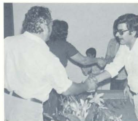
Reny e Senhora, recebendo certificado e rosas.