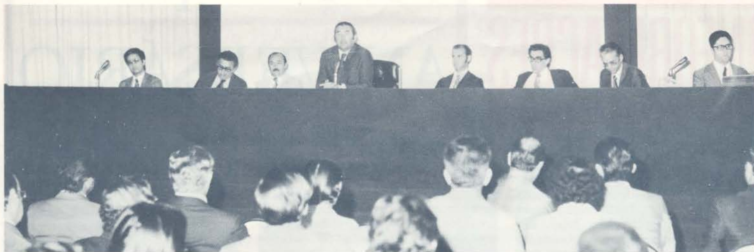
Aspecto da solenidade durante a qual foram entregues os certificados de 10, 15 e 20 anos de serviços a empregados das áreas da Presidência, Diretoria de Operações e Diretoria de Distribuição.